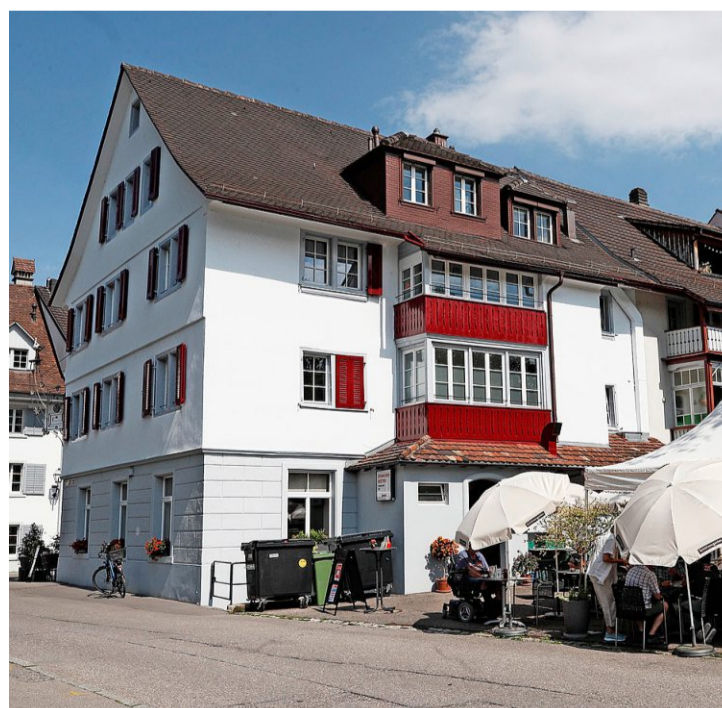
Das Restaurant Storchen hat seine Terrasse erweitert.

Auch die Wiederöffnung wollte vorbereitet sein. Vorerst nur jene drei der Liegenschaft gehörende Parkplätze auch als Terrasse nutzen zu dürfen. Inzwischen ist die Doppelnutzung genehmigt. «Ein totaler Ge-