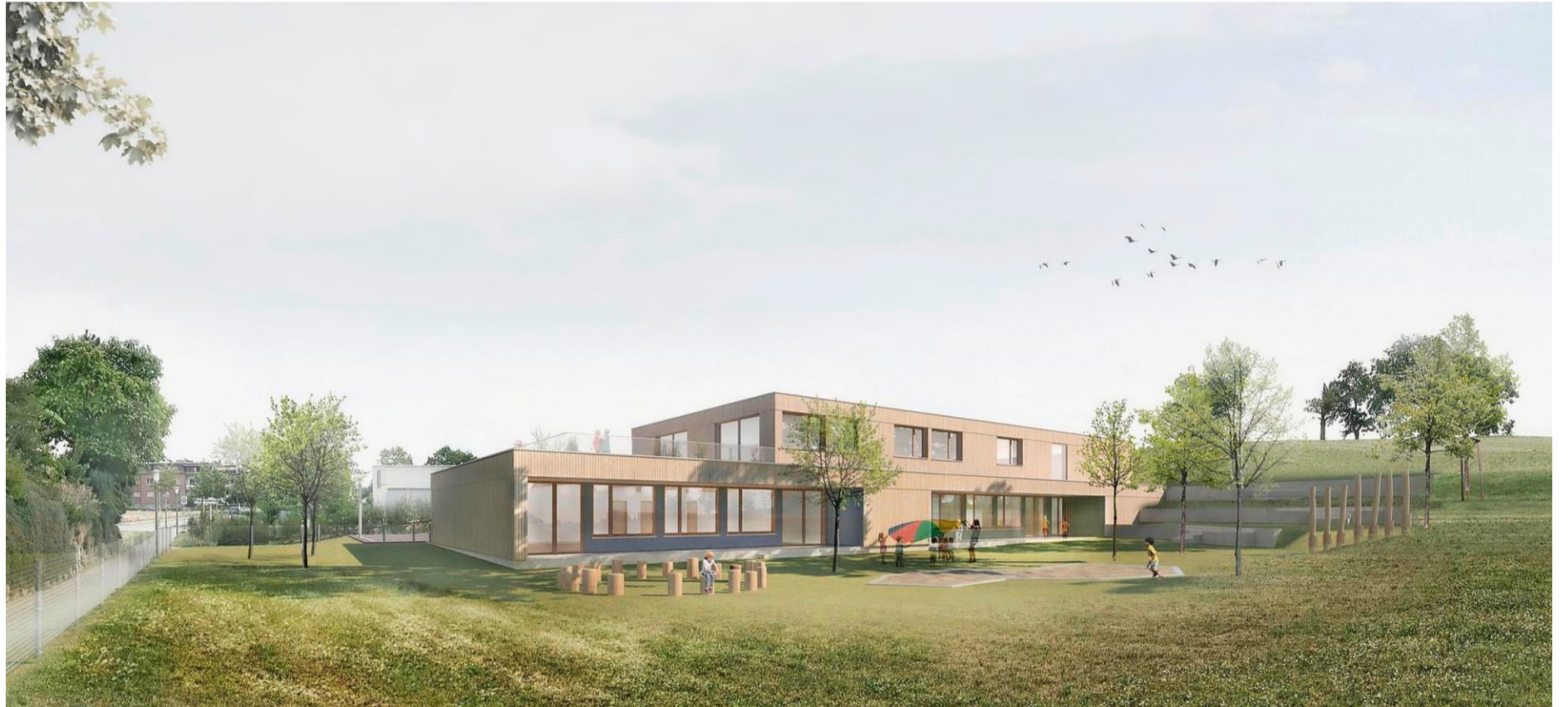
So wird der neue Trakt beim Schulhaus Pächterried aussehen. Der Kindergarten im Untergeschoss, die ausserschulische Betreuung darüber.